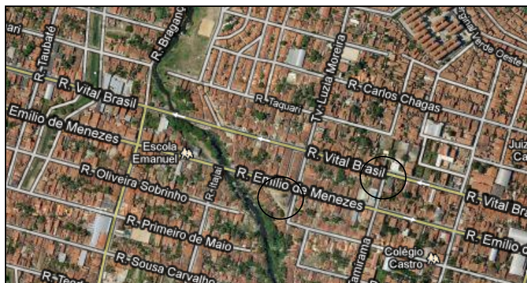
Parte do mapa 7 de Bonsucesso, em divisa com Granja Portugal, Fortaleza - CE

acontece, como já foi dito, sem o reconhecimento e a legitimação da paróquia à qual se vincula o principal templo católico do bairro.