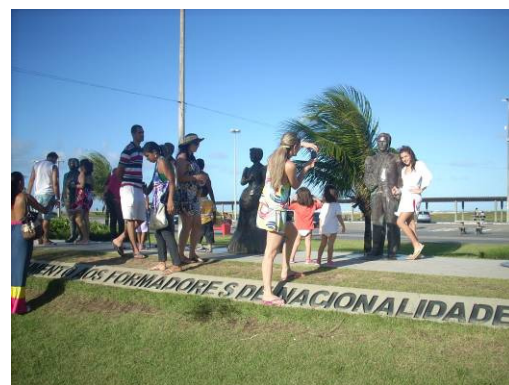
Figura 7 – Monumento pela Nacionalidade.

Além, das características desse espaço denominado “Monumento aos Formadores da Nacionalidade” e os mais variados usos estimulados pelo que mais parece ser um cenário fotográfico. E, além desses, os passos se multiplicam entre os guardadores de carros, os vendedores ambulantes, ciclistas, pessoas que caminham