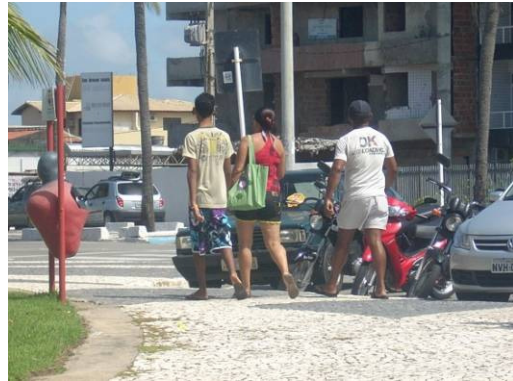
Figura 3 - Caminhantes pela Praça dos Arcos.

Dessa forma a análise parecia contemplar meu objetivo de compreender as sociabilidades estabelecidas em Zonas Litorâneas Enobrecidas, ou seja, processos de Gentrification enquanto “formas de empreendimentos econômicos que elegem certos espaços da cidade como centralidades e os transformam em áreas de investimento público e privado” (LEITE, 2007, p. 61),