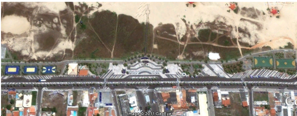
Figura 2 – Aproximação do Cenário I. Autor: Desconhecido. Fonte: www.google.com.br/maps .

Este espaço facilmente poderia ser denominado como um “lugar de passagem” (ARANTES, 1997), um lugar de fluxos, considerando que pouco se permanece nesse local, cuja maioria das pessoas que o utilizam segue por uma passarela de madeira até a praia, poucos param a espera de um conhecido, ou para adquirir bronzeadores nos vendedores ambulantes, que apesar de ficarem mais tempo que os passantes, não tem autorização para o comércio neste local, sendo logo convidados a sair do local pela Superintendência da Orla Marítima de Aracaju (Superoma) 4 .