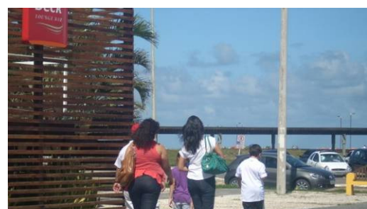
Figura 5 – Espaço freqüentado por surfistas.

Este é um espaço entre o cenário I e o II. Ao final do cenário I há um quiosque que comercializa água de coco, bem como a