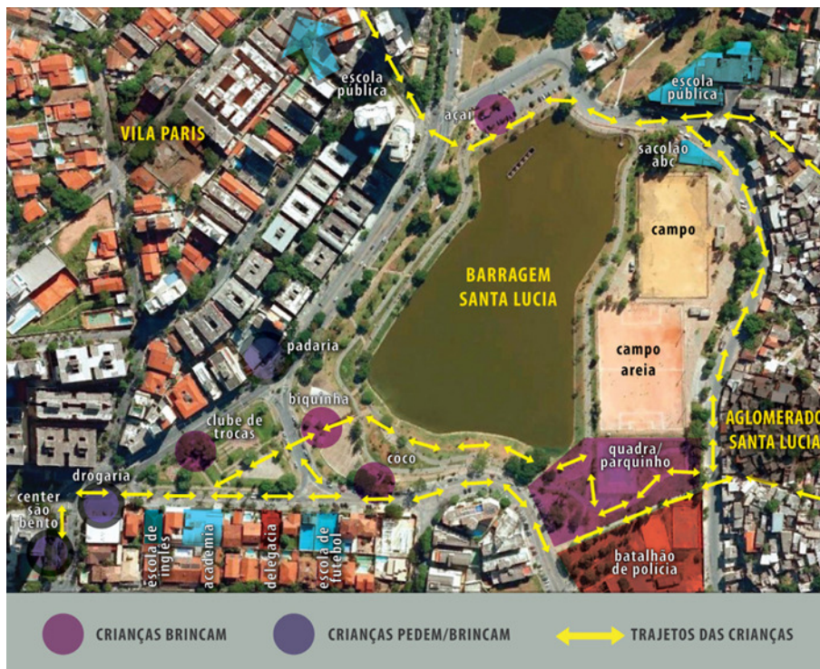
Figura 2: Intervenção do autor com a colaboração de Carla Medina e Luciana Guizan sobre imagem de satélite extraída do Google Earth.

A figura 2 é resultado do exercício de mapeamento etnográfico em andamento, resultado da observação participante no campo descrita anteriormente, realizada a partir da extração de imagem de satélite do Google Earth . É possível observar nesta imagem, o Parque da Barragem Santa Lúcia, o Aglomerado Santa Lúcia e os bairros de classe média nos arredores. Além disto, foram espacializadas algumas das referências importantes do local, tal como escola, batalhão policial, delegacia, academia, etc.