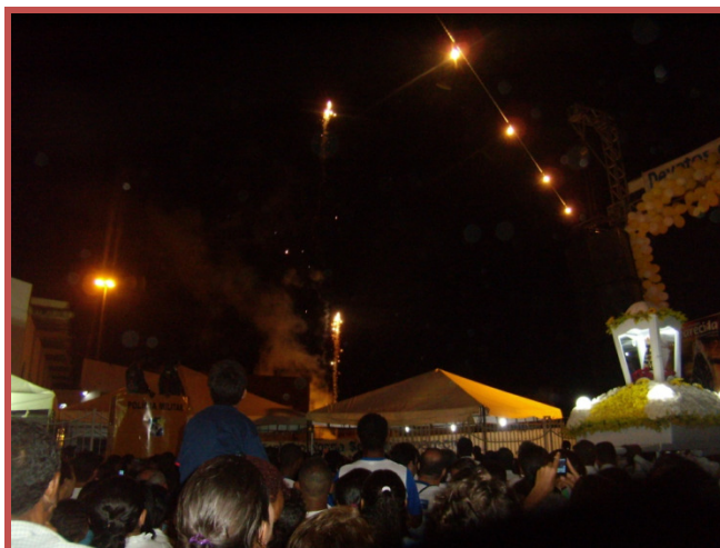
Figura 03: Alvorada no final da procissão de Nossa Senhora Aparecida Foto: Rodrigo Lima, 2010.

A noite cai rapidamente em Aracaju por volta das 17:30 h e, quando o cortejo retorna ao templo, a imagem é recebida com grande queima de fogos (Figura 03), seguida de shows das bandas gospel. A praça e ruas circundantes são tomadas por uma movimentação distinta. A celebração contida sede à dança, os participantes erguem os braços, cantam, falam alto e se abraçam, bebem e comem sentados, em pé, em grupos.