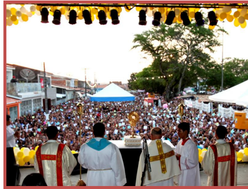
Figura 01: Celebração da missa campal no dia 12 de outubro

O percurso da festa é longo, cerca de 4 km, pelas ruas e avenidas principais como mostra a Figura 02. O percurso foi ampliado pelo Padre Cássio e há seis anos “envelopa” o bairro. Até então o andor era conduzido por caminhonete e o percurso limitava-se às redondezas da igreja. O conjunto das atividades do dia, a ampliação do percurso e a forma de condução mais lenta são atribuídas como fatores determinantes do aumento progressivo de fiéis participantes.