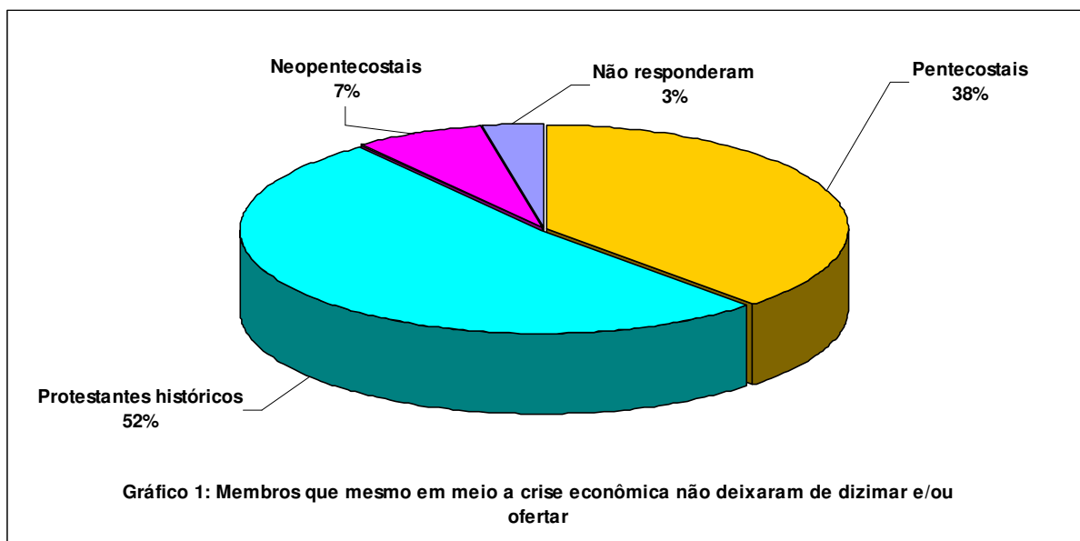
Figura 1: Gráfico como ilustração

QUESTÃO 2: Você alguma vez deixou de dizimar e/ou ofertar após experimentar os efeitos da atual crise econômica?