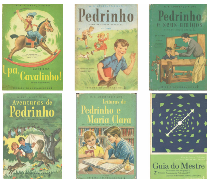
Figura 1. Capas da Série de leitura graduada Pedrinho e do vol. 2 do Guia do Mestre

publica Pedrinho e seus amigos , o segundo livro da série, em janeiro de 1954. O terceiro livro, publicado em janeiro de 1955 é Aventuras de Pedrinho . O quarto livro da série tem como título Leituras de Pedrinho e Maria Clara e foi publicado pela primeira vez em março de 1956. Para encerrar a Série de Leitura Graduada Pedrinho , a cartilha Upa, cavalinho! é publicada em janeiro de 1957.