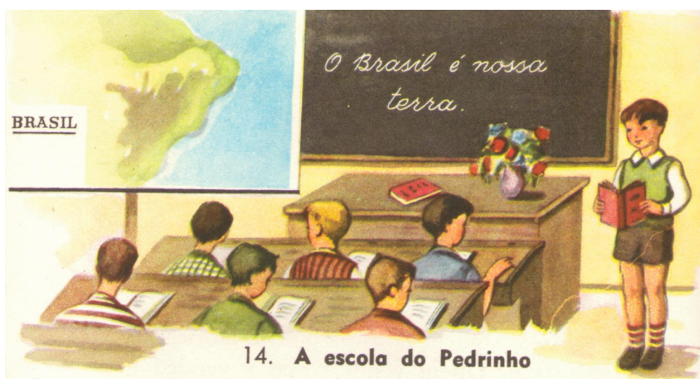
Figura 8. Pedrinho , 1968, 16ª ed. p.30. Ilustração de Maria Böes

Sob esse aspecto, percebe-se uma “invisibilidade naturalizada” nas páginas da coleção como um todo, pois não há negros compartilhando o espaço social em que transita a criança Pedrinho , seus familiares e amigos: os brasileiros que vivem num Brasil urbano, civilizado e moderno. Como já citado, nas lições para a criança da escola primária, o autor registra a miscigenação entre o europeu português e a população nativa das terras brasileiras, porém não há menção à miscigenação entre portugueses e africanos como fato a ser registrado na história social da pátria.