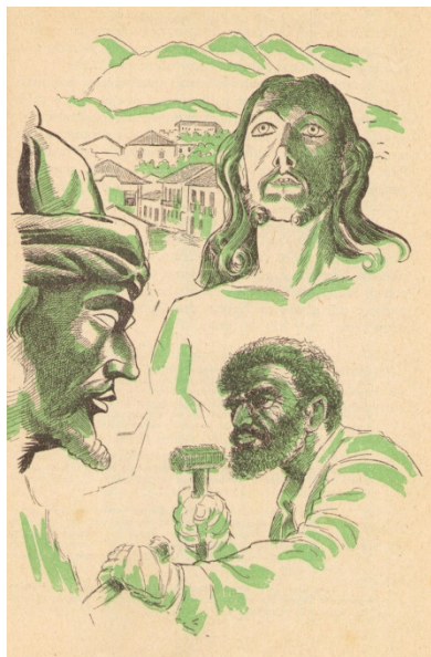
Figura 4. Leituras de Pedrinho e Maria Clara . 1957, 2ª ed., p.77. Ilustração de Oswaldo Storni

capitalistas, que emerge o negro brasileiro nos conteúdos escritos e imagéticos da coleção.