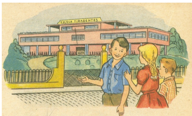
Figura 2. Pedrinho e seus amigos, 5ª ed., 1958, p.18. Ilustração Oswaldo Storni

As edições de todos os livros da Série apresentam as mesmas dimensões – 20cm x 13,5cm. As edições da década de cinquenta obedecem ao padrão capa dura e as da década de sessenta tornam-se mais econômicas ao apresentarem encadernação em brochura. O primeiro livro é ilustrado por Maria Böes e os demais volumes são ilustrados pelo artista plástico Oswaldo Storni. A coleção foi reeditada até 1970, com um total de 4.778.171 exemplares publicados.