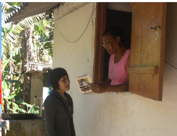
Créditos: Reginensi, em 18/08/2010.