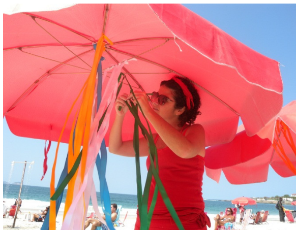
Créditos: Reginensi, em 08/08/2010.