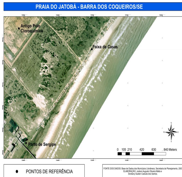
Figura 2: Área correspondente à Praia de Jatobá, situada no povoado Jatobá.